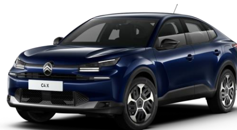
Blue Eclipse (○) métallisé