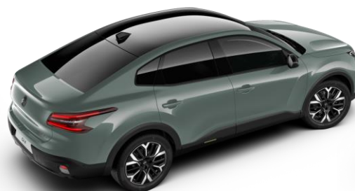
Manhattan Green – toit Noir Perla Nera (○)