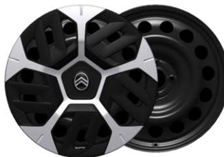
Enjoliveurs 18" AEROTECH