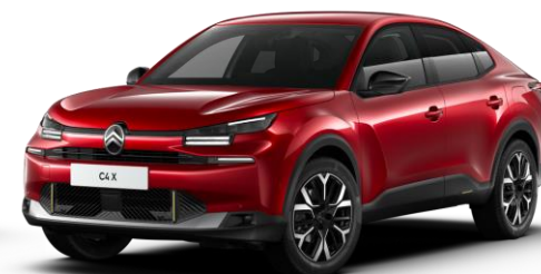
Rouge Elixir (○) nacré avec vernis coloré