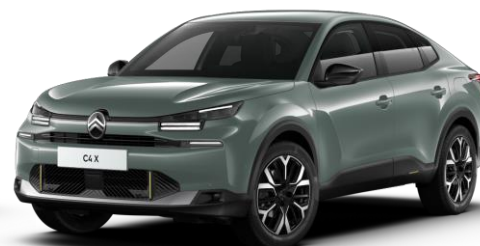
Manhattan Green (○) opaque