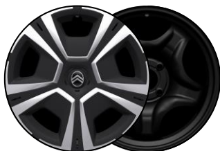
Enjoliveurs 16" STEEL & DESIGN