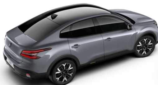
Gris Mercury – toit Noir Perla Nera (○)