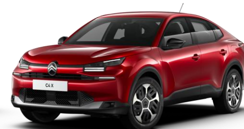
Rouge Elixir (○) nacré avec vernis coloré