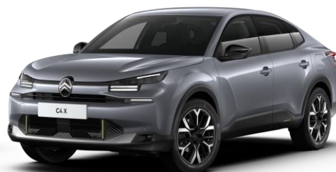
Gris Mercury (○) métallisé