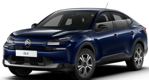
Bleu Eclipse (O) métallisé