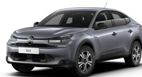
Gris Mercury (O) métallisé