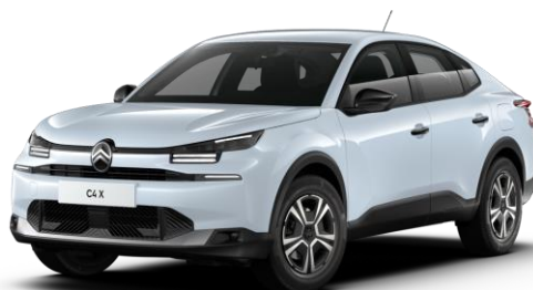
Blanc Okenite (O) métallisé