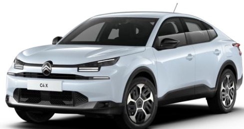
Blanc Okenite (○) métallisé