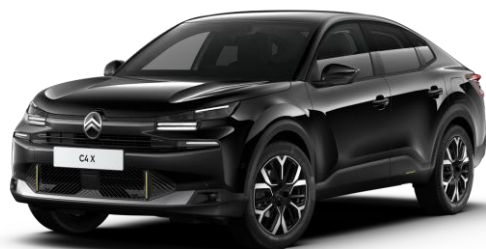
Noir Perla Nera (●) nacré