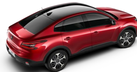
Rouge Elixir – toit Noir Perla Nera (○)