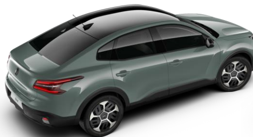
Manhattan Green – toit Noir Perla Nera (○)