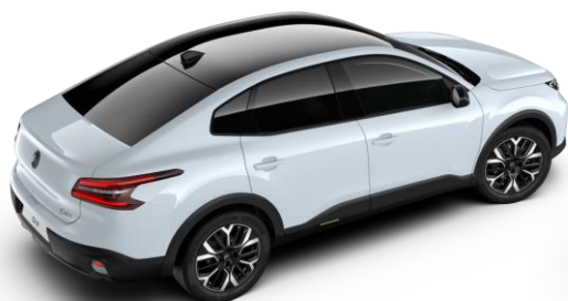
Blanc Okenite – toit Noir Perla Nera (○)