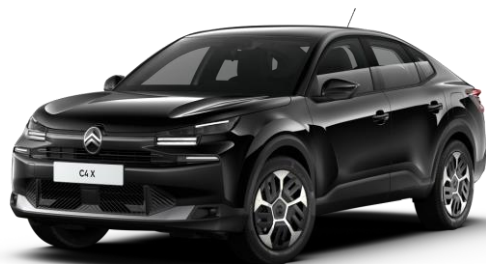
Noir Perla Nera (●) nacré