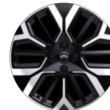
Jantes alliage 18" AMBER Diamantées

● Série ○ Option # Réservée aux sociétés