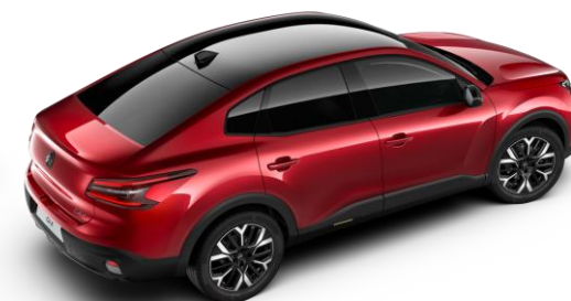
Rouge Elixir – toit Noir Perla Nera (○)

● Série ○ Option # Réservée aux sociétés