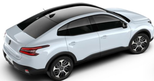
Blanc Okenite – toit Noir Perla Nera (○)