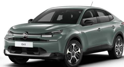
Manhattan Green (○) opaque