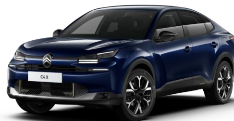
Blue Eclipse (○) métallisé