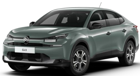
Manhattan Green (O) opaque