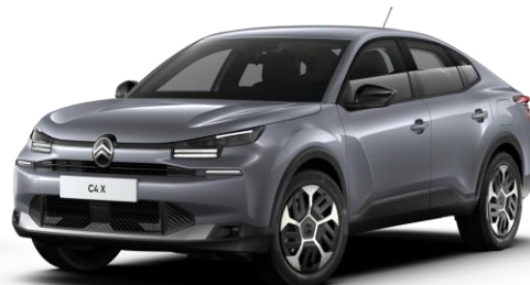
Gris Mercury (○) métallisé