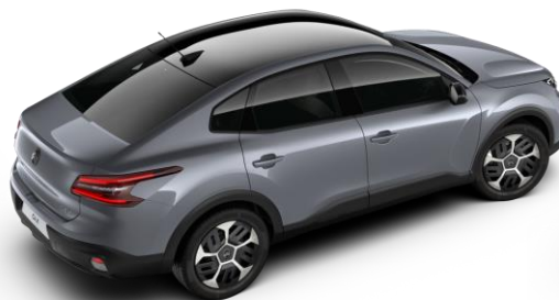
Gris Mercury – toit Noir Perla Nera (○)