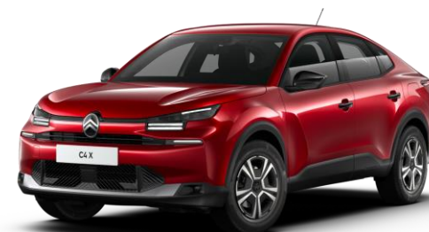
Rouge Elixir* (O) nacré avec vernis coloré