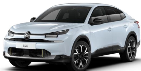
Blanc Okenite (○) métallisé